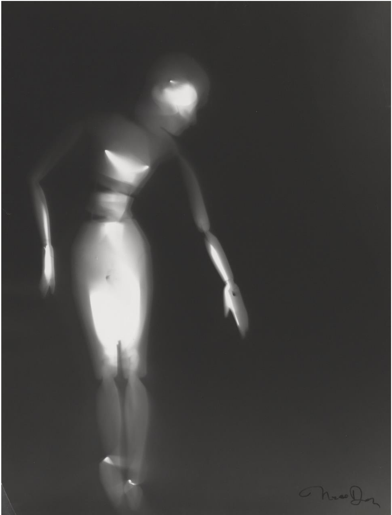
Nell Dorr (1893–1988) The Puppet Dances #7 , 1925–1970s Gelatin silver print

Amon Carter Museum of American Art, Fort Worth, Texas, Gift of the Estate of Nell Dorr © 1990 Amon Carter Museum of American Art P1990.45.284